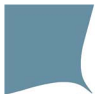
Tabella 1 - Collegamento tra aspetti del QdR Invalsi e Indicazioni Nazionali